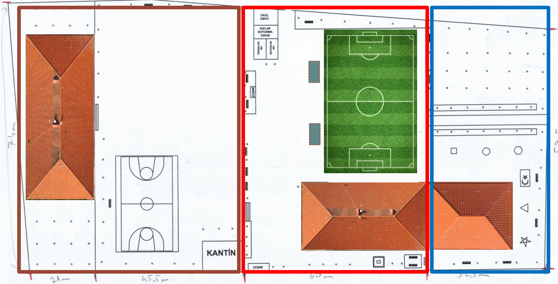
BUHARKENT ÇOK PROGRAMLI LİSESİ YERLEŞİM PLANI